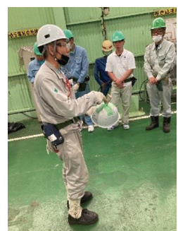
高所からの落下物の危険 ヘルメットに突き刺さった金矢