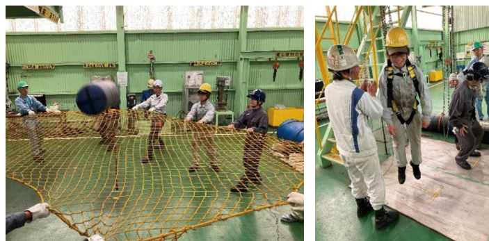
みんなで30キログラムの落下物を受け止める。フルハーネスによる吊り下げ体験

4mの高さから道具を落とし、たことを想定しヘルメットに金矢(鉄製の楔)を落としての見学では、落下した金矢がヘルメットに突き刺さり、高所での道具類の落下防止に細心の注意を払う必要がある事を実感しました。