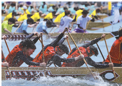
1部【推薦】『デッドヒート』