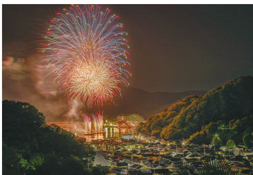
2部【推薦】『港町を染める夜空の宴』