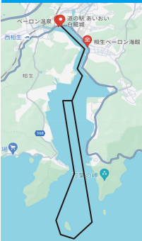
クルージング予定のコース

※クルージングの事前予約は行いません。当日直接受付にお越しください。 また、ペーロン城では相生商工会議所青年部主催の3市商工祭「西播磨オータムフェスタ」が開催されます。合わせてお楽しみください。