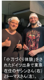
「小刀づくり体験」を実施している鍛刀場は珍しく、シェフをされて、刀を作る過程に興味があったというお2人は「全ての工程が楽しかった!」と笑顔で話してくださいました。